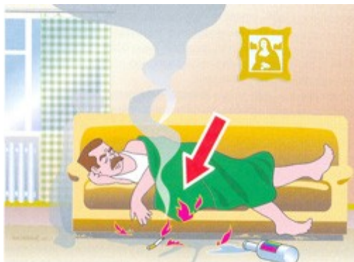
На пожарах, вызванных курением, ежегодно погибают до 2500 человек.

Прежде всего проверьте, безопасен ваш дом или квартира. Возможно, придется изменить некоторые привычки. Поэтому стоит обратить внимание на некоторые оговорки. Ежегодно почти 70% погибших на пожарах попрощались с жизнью из-за неосторожного обращения с огнем. На пожарах, вызванных курением, ежегодно погибают до 2500 человек. Опасно курить в кресле, на диване, в постели перед сном, особенно в состоянии опьянения. Оставленные сигареты, которые тлеют, - прямой путь к пожару.